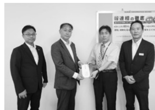
スズキ販売労働組合 自販新潟支部