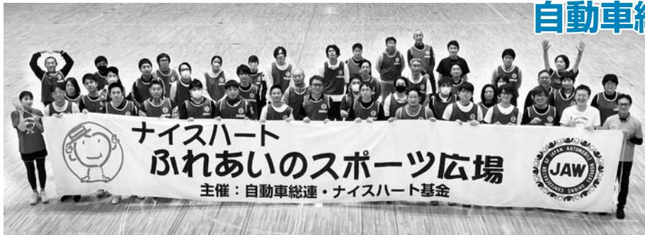
2023年Nice Heartふれあいのスポーツ広場