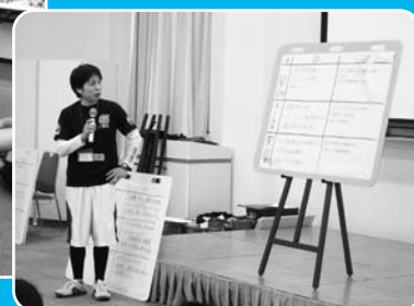
成果を発表します！我々のチームが1番だ！

2024年5月18日(土)から19日(日)の2日間、スズキ労連第52期ヤングリーダー研修をつま恋リゾート彩の郷にて開催しました。