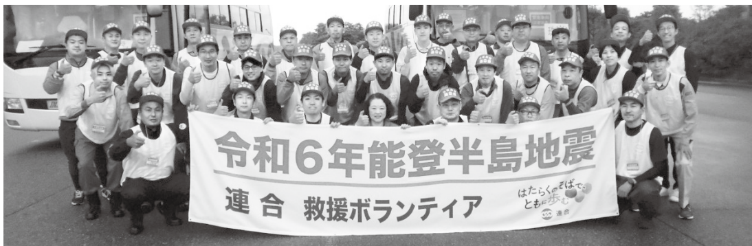
連合救援ボランティア第10クール参加者