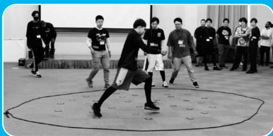
【キーパンチ】1～30番のマットをチームメンバー(1人づつ)で順番に触れていき、チームで設定した目標タイムクリアを目指す！