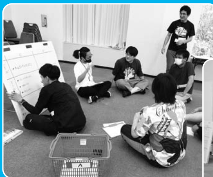
研修2日間の学び、成果をみんなで まとめよう