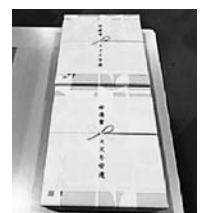
スズキ部品富山労働組合 ボウリング大会スズキ労連賞

主には各組合・各支部が主催するボウリング大会などで「スズキ労連賞」を賞の一部にして利用していただいておりますが、ボウリング大会のみならず、組合の文体行事全般を対象としていますので、是非各組合の文体行事への積極的な参加をお願いします。