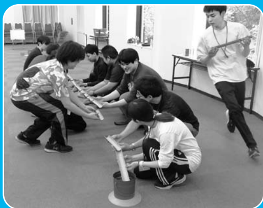
【ハーフパイプ】一人ずつ半筒状のパイプを持ち、ビー玉を落とさないように転がし、ゴールのバケツまでどれだけ多く効率よく運べるか4チームで勝負だ！