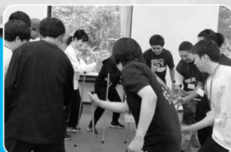
【とんば】サークルを作り、1人1本持ったスティックを「トン・トン」で地面に2回突き「バ」で手を放すと同時に隣のスティックを掴む。チームの息が合わないとマジ無理ゲー