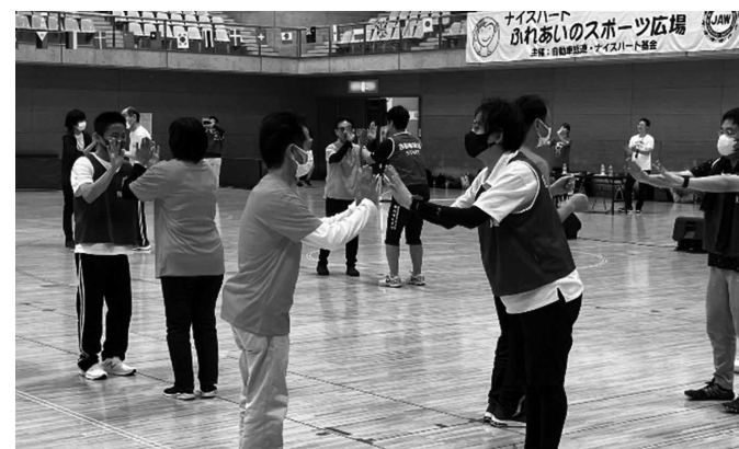
じゃんけんダンス

2023年11月4日(土)、自動車総連静岡地協のナイスハートふれあいのスポーツ広場が静岡市北部体育館で開催されました。大会ではナイスチームとハートチームに分かれ、障がい者の皆さんと共に「風船シュート」「風船バス」「風船パレード」「じゃんけんダンス」などで楽しく汗を流しました。僅差の勝負もあり、自動車総連実行委員の皆さんも一緒になって盛り上がっていました。参加者全員の笑顔と施設の方々の感謝の言葉により、元気と感動を頂いた一日となりました。