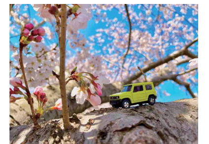
桜とジムニー ペンネーム:イカ (スズキ販売労働組合 自販山口支部)