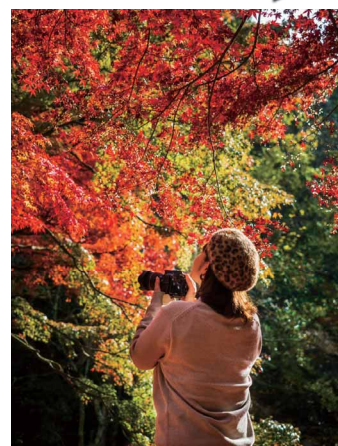
明日に向かって 安井 夢子 (スズキ労働組合 営業出向(自販長野))