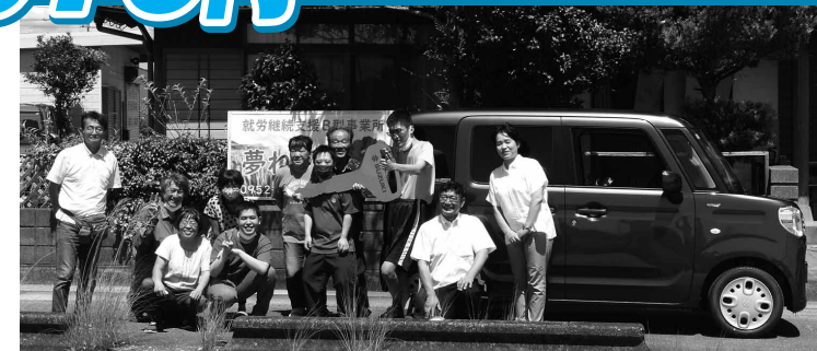
スペースを寄贈しました。

皆さんからいただいたカンパ金で身体障がい者・児施設、知的障がい者・児施設、自立のための授産施設を中心に、困窮している施設へスペースを寄贈しました。