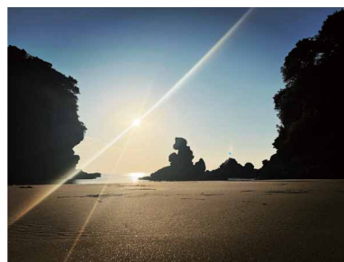
夕日 ペンネーム:スズ (スズキ販売労働組合 自販鹿児島支部)