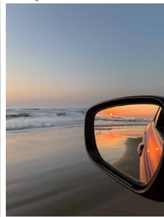
君の眼に映るもの 井川 領 (スズキ販売労働組合 自販熊本支部)