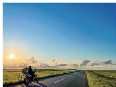
地平線の向こうへ 久保 英二 (スズキ労働組合 営業出向(自販富山))