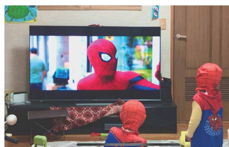
スパイダーキッズ ペンネーム:ブンブン1996 (スズキ販売労働組合 自販高知支部)