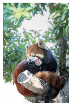
リーファの大あくび ペンネーム:リッサー-パンダ好き (スズキ労働組合 本社支部)