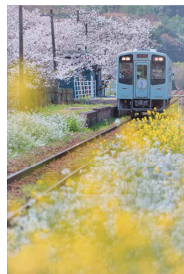
春の彩に囲まれて ペンネーム:トム (スズキ労働組合 本社支部)