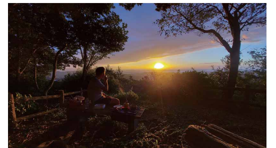
至福の時 ペンネーム:びろてい (ベルソニカ労働組合 本社工場)