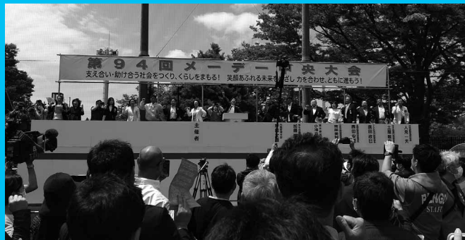
参加者全員でガンパロー三唱！