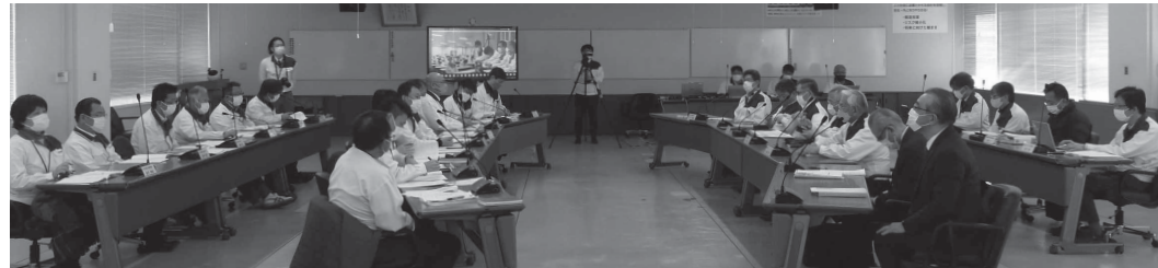
スズキ労組団体交渉の様子