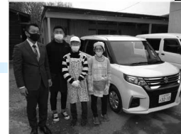
社会福祉施設への車輛寄贈

自動車総連との連携やスズキ労連独自でカンパを募り、被災地へのお見舞い、福祉施設の充実、発展途上国への支援のために、車両や物品を寄贈しています。