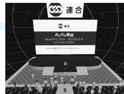
連合 中央総決起集会

自動車総連、連合、金属労協等の上部団体や外部組織、友誼労組との連携を図っています。とりわけ、静岡県においては、自動車総連静岡地協のリーダー労連であることを自覚しつつ前向きな対応を図っています。