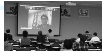
政策制度・政治研修会

組合員の(政策・制度上)税制上の不利益を防ぐと共に生活の安定、生活向上のために、「税制」「社会保障制度」などの政策・制度課題改善に積極的に取り組んでいます。組織内議員や推薦議員と連携を図り、政策の実現を目指しています。