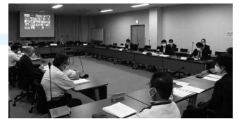
拡大中央共闘会議

組合員の雇用を守り、生活の維持・向上を実現すると共に、「スズキグループ全体として魅力ある企業作り」を目的に、働く喜びと誇りが持てるよう、賃金・年間一時金・労働条件の改善の取り組みを推進しています。