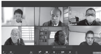
真剣に受講する参加者たち