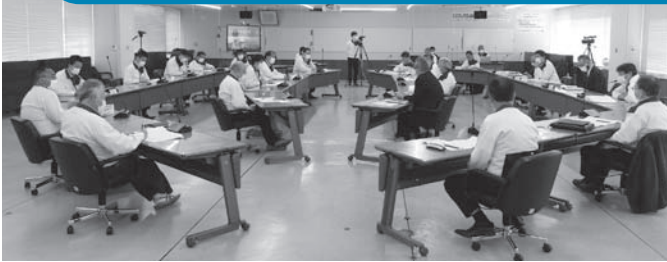
スズキ労組交渉の様子