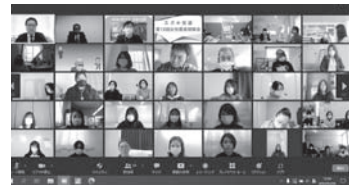
55名の女性委員が受講しました！