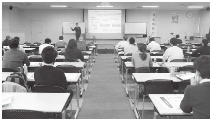
SUN会館での会場風景