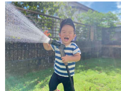
水やりのはずが…楽しいな! ペンネーム: ミヤケイ (スズキ労働組合 浜松支部)