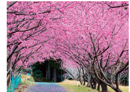
花桃トンネル ペンネーム: Mitsu (スズキ労働組合 本社支部)