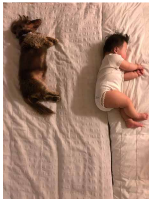
前~ならえ ペンネーム: ユメロニ (スズキ労働組合 磐田支部)