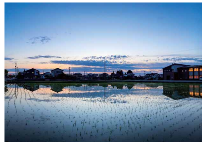
無題 宮下 風我 (スズキ部品富山労働組合)