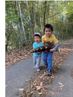
たけのご運びます ペンネーム: ハリネズミ (スズキ労働組合 本社支部)