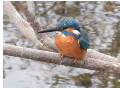
会心の一枚 立石 孝之 (スズキ労働組合 本社支部)