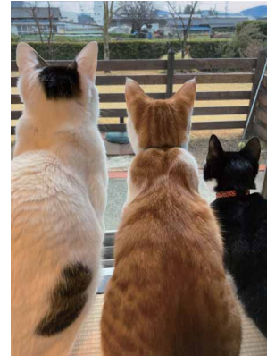
家族みんなで ニャルソック 松井 靖典 (スズキ販売労働組合 東海支部)