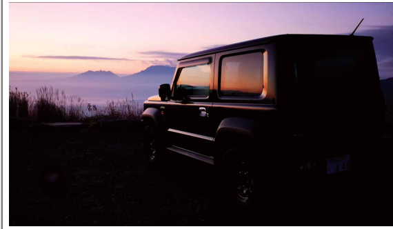
後世に残したい車と景色 嘉場 麗圭 (スズキ販売労働組合 熊本支部)