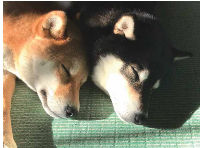
シンクロ ペンネーム: いよえい (スズキ労働組合 浜松支部)