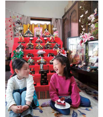
幸せ時間♪ ペンネーム: めめる (スズキ労働組合 本社支部)