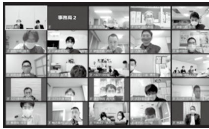
(写真)拡大中央共闘会議の様子

スズキ労連加盟の製造・輸送部門の各組合は、要求書提出以降、3月内の回答引き出しに向けて会社側と粘り強い交渉を続け、スズキ労組が3月17日(水)に、スズキ労組以外の製造・輸送部門9組合中8組合が3月29日(月)から3月30日(火)にかけて回答を受取りました。