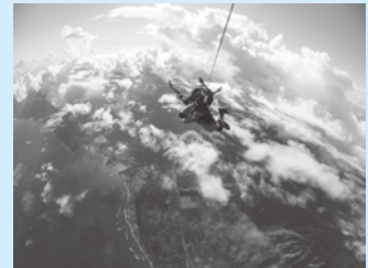
優秀賞「令和初スカイダイビング」 スズキ労組 ベンネーム：しゅーぞー