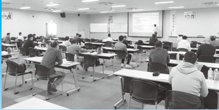
SUN会館での会場風景