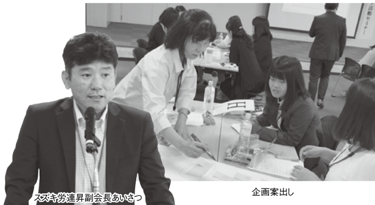
スズキ労連昇副会長あいさつ