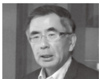
スズキ(株)代表取締役 鈴木俊宏社長

本労使会議にて、スズキグループが置かれている現状と今後の方向性について、労使が一層共通認識に立ち、信頼関係を深める意見交換を行うことが出来ました。