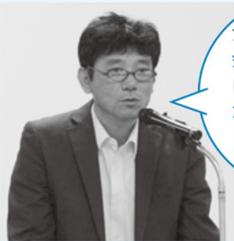
スズキ労連 昇副会長

介護に直面したら、 会社または労働組合 に相談し、働き続け ながら介護をサポート していくようにして 下さい。