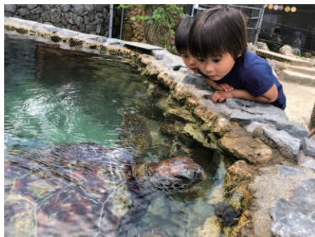
亀さんとおしゃべり