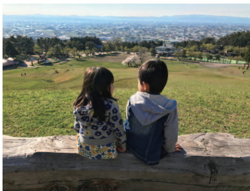
お花見デート!! 肥塚寛成(スズキ納整労働組合 富山事業所)