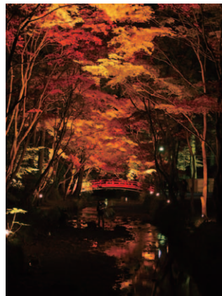
今年も色づいた! 森下友皓(スズキ労働組合 浜北トリム支部)