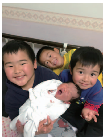
プリンセスと3人の騎士