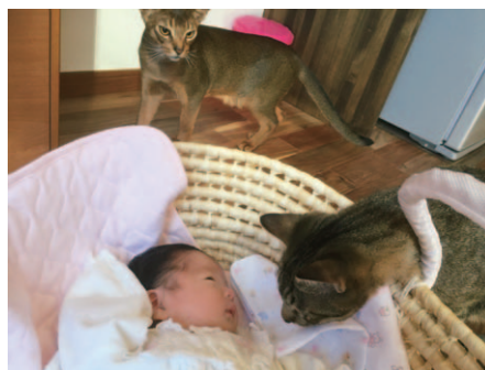
僕たちがお兄さんだよ