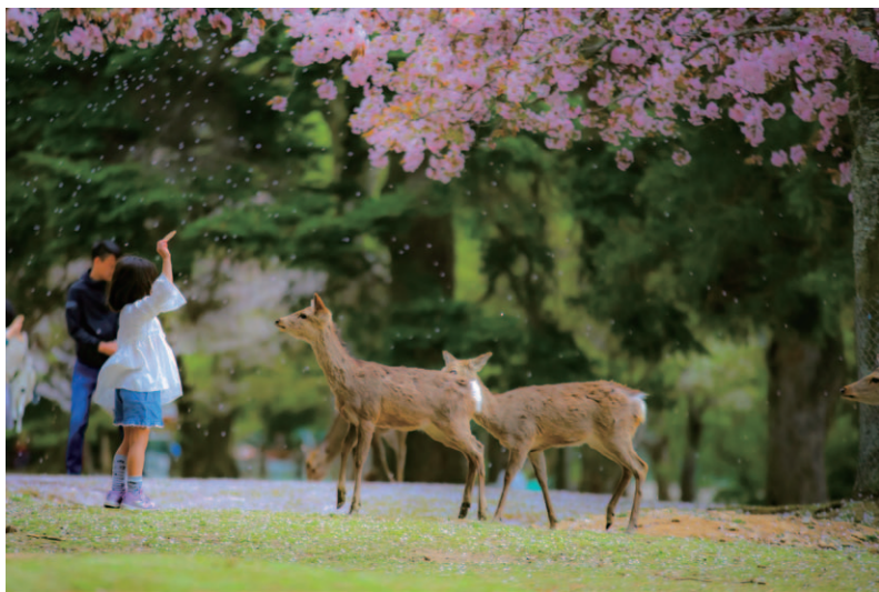
桜の中で鹿寄せする子供 坂田一久(スズキ販売労働組合 自販西埼玉支部)