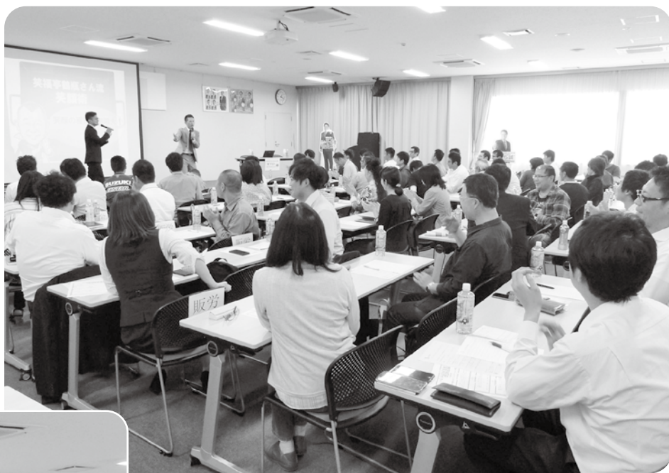
笑顔が絶えない会場