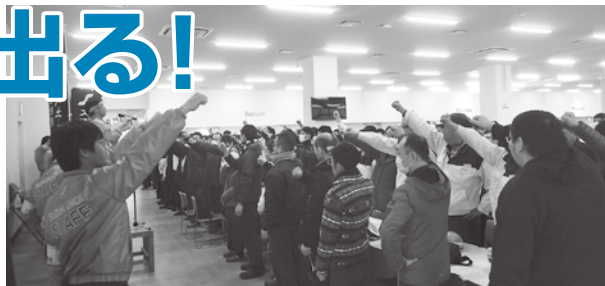
回答日前日の全員集会の様子。回答引き出しに向け全員の意思統一を図った(スズキ労組)

スズキ労連加盟の製造・輸送部門の各組合は、2月19日(月)~2月21日(水)にかけて要求書を提出、3月内の回答引き出しに向けて共闘し、会社側と粘り強い交渉を続けてきました。そして、スズキ労組が3月14日(水)に、製造・輸送部門の9組合が3月28日(水)~3月30日(金)にかけて回答を受け取りました。