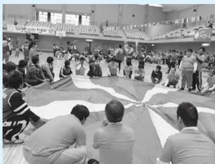
競技：ホールインワン