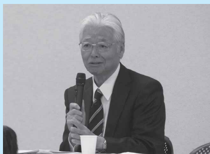
直嶋正行政治政策研究会 直嶋正行代表 講演「議員24年を終えて～伝えたいこと～」