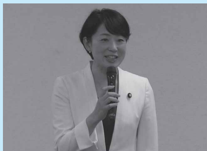
平山佐知子参議院議員 衆議院立候補者応援