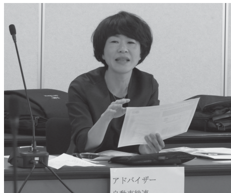
アドバイザー 自動車総連 熊野局長