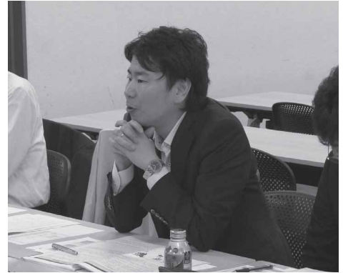
アドバイザー 労連 中野中執