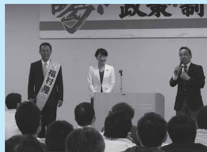
田口章 静岡県議会議員 衆議院立候補者応援