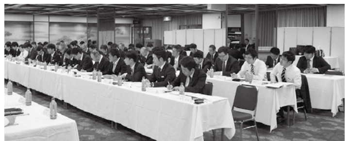
スズキ販売労組51支部の委員長・スズキ販労本部が出席(左：スズキ(株)国内営業本部、管理本部 右：組合側)

2017年総合生活改善の取り組み(春の取り組み)もいよいよ大詰めを迎え、4月7日(金)にグランドホテル浜松にて、スズキ(株)国内営業本部と全国51支部代表者が一堂に会し、意見交換会を行いました。会社側からは2016年度の業績見込みと2017年度の国内営業部門の方針説明があり、組合側からは代表6支部(自販北海道支部・自販栃木支部・自販長野支部・自販広島支部・自販香川支部・自販宮崎支部)の支部執行委員長より、1年間の組合員の努力と頑張りを訴えました。