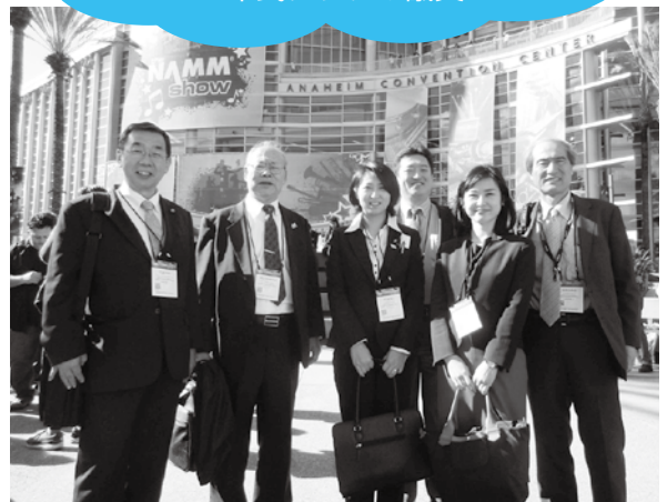
NAMM Show会場をバックにする 市民クラブの議員

毎年、アメリカ カリフォルニア州アナハイムで開催される世界最大規模の楽器(音楽関連機器等)の国際見本市です。出展社数は1,500社を超え、世界100か国以上から有力バイヤーが集結するなど、来場者は10万人以上となり、非常に注目度の高いイベントです。