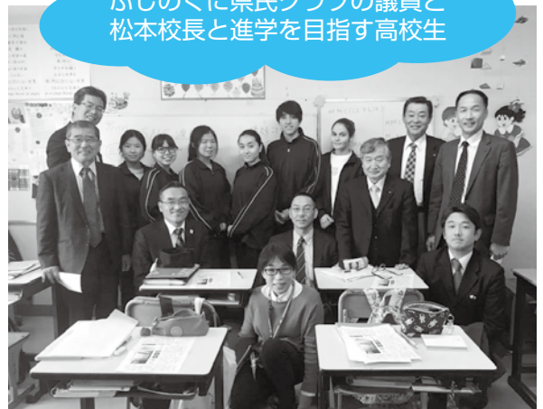
ふじのくに県民クラブの議員と 松本校長と進学を目指す高校生

静岡県浜松市西区にある在日外国人のための外国人学校。 学校名「ムンド・デ・アレグリア」はスペイン語で「喜びの 世界」という意味