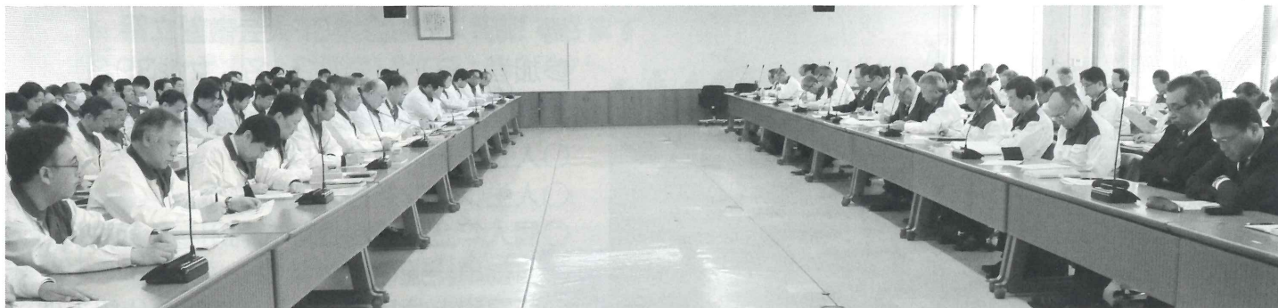
スズキ労働組合の第1回交渉(2月22日)の様子 [左:組合側、右:会社側]