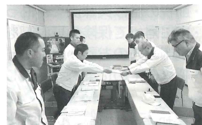
要求書を提出するスズキ労働組合中島中央執行委員長(左)と、スズキ(株) 本間社長(右)