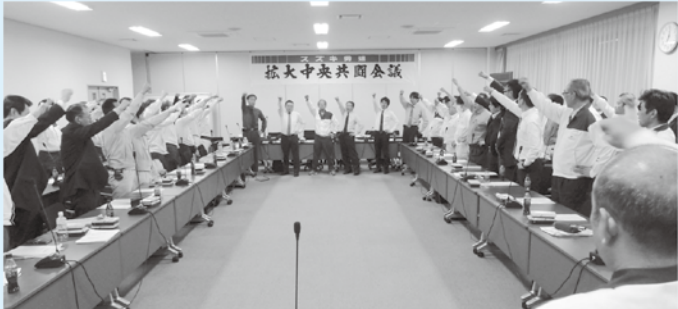
2016年3月スズキ労連拡大中央共闘会議の様子