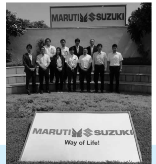
マルチスズキ社様前にて 第16次海外調査団 団員

スズキ労連は16回目となる「第16次海外調査団」として5月29日(日)から6月3日(金)の6日間で、インドに調査団を派遣致しました。今回の調査国は、スズキグループの重要な拠点となっているマルチスズキの生産及び販売状況を調査し、経営側との情勢認識を共有すると共に、インドの住環境や物価動向を確認し、インドへの出張者等へのサポート活動に活かしていくため、選定致しました。インドでは、マルチスズキ社(MSIL)様を初め、SMIPL様やベルソニカ・インディア様や販売店(NEXA)などを見学させて頂きました。また、建設中のスズキ・モーター・グジャラート社(SMG)様も見学させて頂きました。今後は、参加頂いた各調査団員の報告をまとめ「第16次調査報告書」としてまとめて行きます。