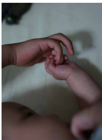
生まれたよ 坂本和之 (スズキ納整労働組合 岡山事業所)