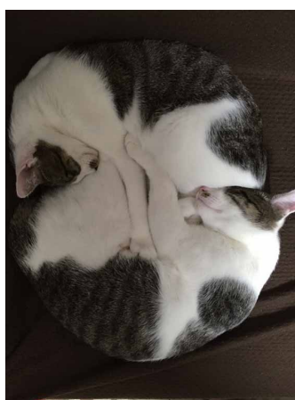
私のいやし 山本 功 (スズキ労働組合 高塚支部)