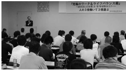
大勢の参加者が集まりました