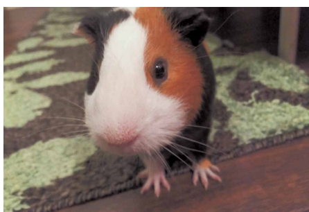
野菜をください! 東 有里 (スズキ販売労働組合 自販岩手支部)