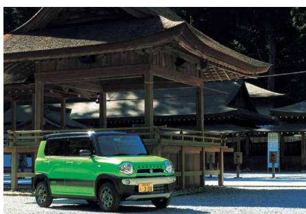
輝くHUSTLER 石塚 孝 (スズキ労働組合 湖西支部)