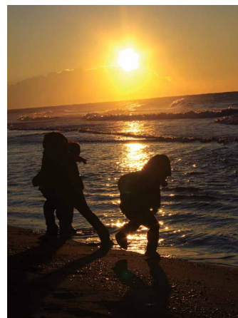
初日の出 鈴木正行 (小楠金属・熱処理労働組合)