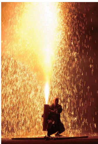
男気みせるぞ!! 大林英之 (スズキ納整労働組合 湖西事業所)