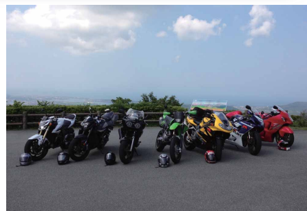
最高の仲間と最高のバイクで最高の場所へ 氏原崇志 (スズキ労働組合 竜洋支部)