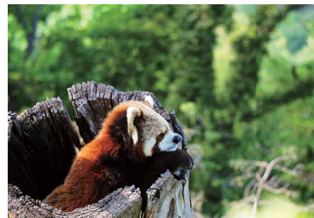
視線の先は… 藤田一義 (スズキ新潟販売労働組合)