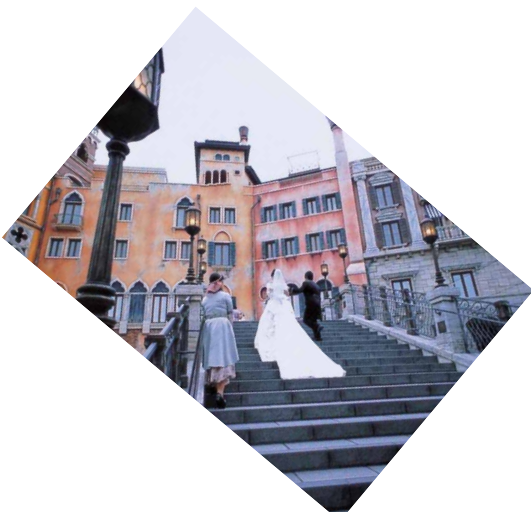
思い出の地から 大倉俊介 (スズキ販売労働組合 自販中部支部)