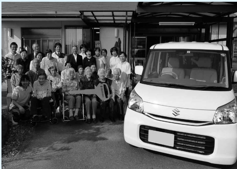
2015年：特定非営利法人ぬくもりホーム「デイサービスぬくもり」にスペースア寄贈（浜松市）

静岡県浜松市 特定非営利法人ぬくもりホーム 「デイサービスぬくもり」 スペースア