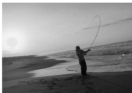
朝日と遠州灘と私 後藤浩 (スズキ労働組合 豊川支部)