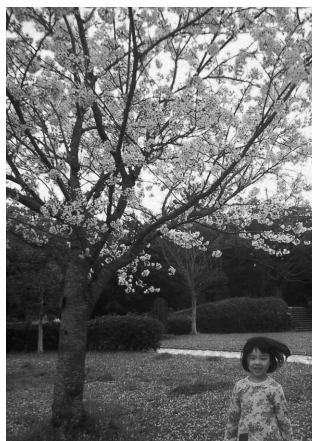
桜の木の下で 中村陽介 (小楠金属・熟処理労働組合)