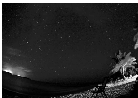
星降る夜の特等席 佐藤裕市 (スズキ労働組合 マルチグルガオン)