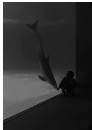
イルカをてなずけた 玉木佑典 (スズキ部品製造労働組合 部品浜松支部)