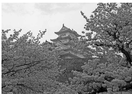
桜と白鷺城 吉川貴弘 (スズキ労働組合 高塚支部)