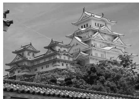
白すぎる"白鷺城" 山本邦之 (スズキ労働組合 湖西支部)