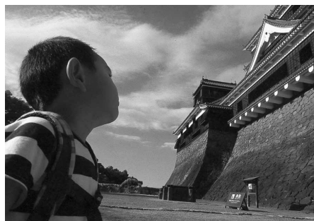
なんじゃこれ 松本吉博 (スズキ販売労働組合 自販南東京支部)