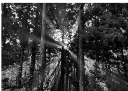
木漏れ日 山空聡広 (スズキ労働組合 磐田支部)