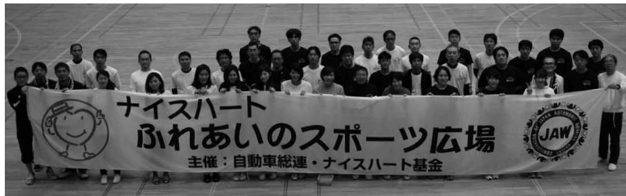
42名のボランティアで参加いただいたスズキ労連実行委員・競技員の皆さん、お疲れ様でした。

「ナイスハートふれあいのスポーツ広場」は自動車総連の20周年記念事業として、平成4年から財団法人国際障がい者記念ナイスハート基金の協力を得て開催されています。スポーツを通じてハンディキャップをもった方々と自動車産業に従事する組合員とがふれあいを深め、そういう中から「自立の心」と思いやりの心」を育む事を目的として開催されています。