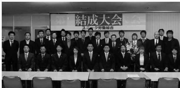
スニック労働組合執行部

2014年11月15日スニック竜洋シート工場(旧スニック)にて「スニック労働組合」の結成大会が開催されました。