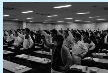
最後は全員のがんばろう三唱で締めくくりました