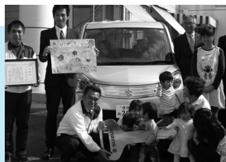
「豊橋ひかり乳児院」へヘリオを寄贈

昨年はスズキ労連より4施設に4台の車両を寄贈することができました。本年も皆様のあたたかいご協力をお願い致します。