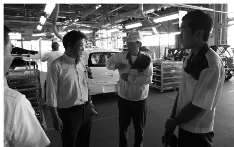
工場に隣接する(株)スズキ納整東日本 富山事業所内も見学をさせていただきました。お客様の元に届ける車のオプション部品等の取り付けを行っていました。