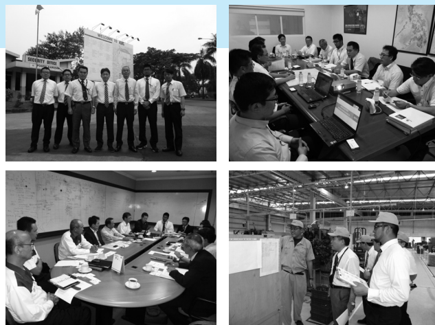
訪問先では駐在者との意見交換や工場見学を実施させていただきました。

なお、調査の詳細については調査団員からの報告をまとめた報告冊子を後日加盟単組にも配布させていただく予定です。