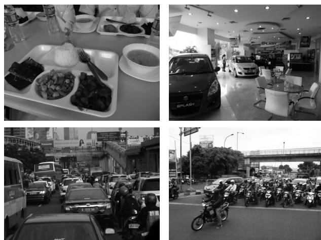
工場の昼食や現地ディーラーへの訪問も実施しました。二輪、四輪ともに交通量には圧倒されます。