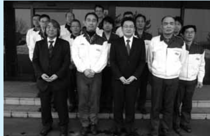
2/14 スズキ部品秋田労組 訪問