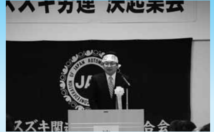
1/25 スズキ労連 決起集会