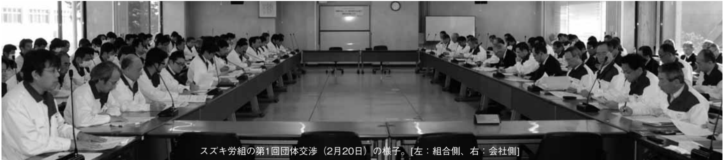
スズキ労組の第1回団体交渉(2月20日)の様子。[左:組合側、右:会社側]

自動車産業は、エコカー補助金終了や新興国の経済成長の鈍化、長引く円高による輸出環境の悪化などにより、先行きについてはいまだ不透明な状況が続いています。各社とも厳しい経営環境下にある中で始まった「2013年総合生活改善の取り組み」において、スズキ労連加盟組合は労連取り組み方針にもとづき、独自の要求内容を策定し、2月20日(水)に要求書を一齐に提出し、会社側との交渉がスタートしました。(スズキ労組は2月13日(水)に先行提出)