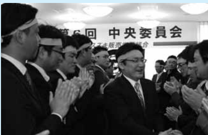
2/6 スズキ販労 中央委員会