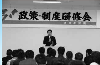
11/17 スズキ労連 政策・制度研修会