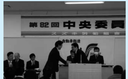
2/3 スズキ労組 中央委員会