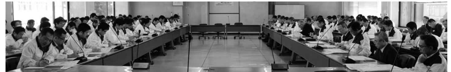
スズキ労組の第1回団体交渉(2月21日)の様子。[左:組合側、右:会社側]

自動車産業は、東日本大震災の影響を受け、国内の生産・販売とも大幅な減少を余儀なくされるとともに、想定を上回る超円高が続くなど、先行きについてはいまだ不透明な状況が続いています。各社とも厳しい経営環境下にある中で始まった「2012年総合生活改善の取り組み」において、スズキ労連加盟組合は労連取り組み方針にもとづき、独自の要求内容を策定、スズキ労組は2月16日(水)に、ほとんどの製造輸送部門・スズキ販売労組各支部では2月22日(水)に要求書を提出、会社側との交渉がスタートしました。