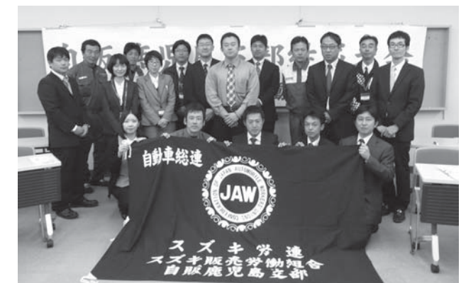
フレッシュな執行部の皆さんです。今後ともよろしくお願いします。

2012年2月23日(木)、鹿児島市にあるオロシテイホールにおいて、「スズキ販労組 自販鹿児島支部」の結成大会が開催されました。スズキ販労組では50番目の支部結成となり、新たに177人の仲間がスズキ労連に加わりました。結成大会では、組合の綱領・規約が確認され、また、今後の活動の基本となる「支部運動方針」「支部活動計画・予算」が審議され、満場一致の大きな拍手で承認されました。