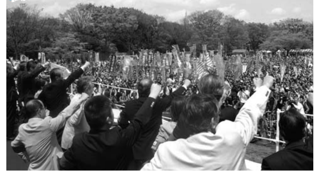
中央メーデー・中央式典の様子。3万人以上の働く仲間が代々木公園に結集しました。式典最後はすべての働くものの連帯を誓う「ガンバロー三唱」。

社会の底割れに歯止めをかける! 雇用を確保、創出する政策制度を実現し、働くものの生活を守ろう!