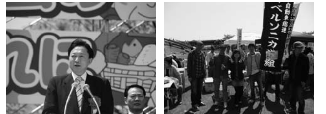
中央式典には鳩山総理が来賓として出席。挨拶では安心な世の中づくりへの決意を示されました。連合静岡湖西地協メーデーではベルソニカ労組がジュースの模擬店を担当。