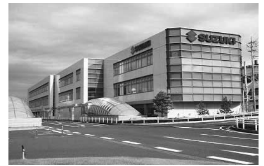
「スズキ歴史館」外観