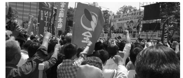
中央メーデー・中央式典の様子。3万人の「ガンパロー」は圧巻でした。

働く者の連帯で「平和・人権・労働・環境・共生」に取り組み、労働を中心とする福祉型社会と自由で平和な世界をつくろう!