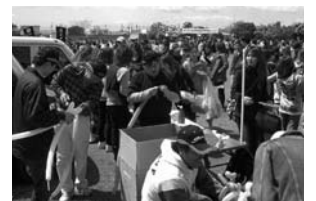
連合静岡湖西地協メーデーではスズキ労連支部がバールンアートで参加者を楽しませました。