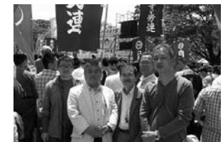
こちらも中央メーデーの様子。スズキ労連からも、元気に8名が参加。