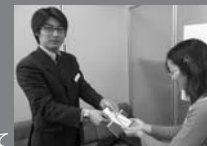
写真: 中日新聞 東海事業部にて

12月25日(火)、クリスマスフェスタでのチャリティーバザーの売上金と募金箱への寄託金、合計18,090円を中日新聞社会事業団 東海事業部「年末助け合い運動」に寄託いたしました。寄託金使途は主に生活保護を受けている家庭のお子さんに図書券を配布するといった地域福祉の向上に使われます。今回も多くの組合員の皆さんにバザー品を提供していただきました。皆様のご協力に深く感謝し、この場をお借りして厚く御礼申し上げます。