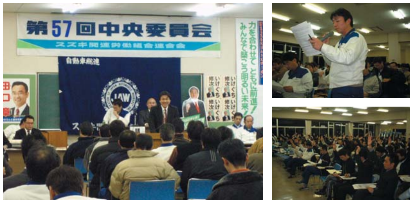
昨年(2007年)のスズキ労連中央委員会の様子。この委員会で労連方針を可決、決定した。

まもなく始まる「2008年総合生活改善の取り組み(春の取り組み)」。スズキ労連の取り組み方針は1月16日(水)に開催されるの自動車総連・第75回中央委員会で決定される方針に基づき、執行部で議論を重ね、2月1日(金)に開催されるスズキ労連・第58回中央委員会で提案されます。中央委員会の方針決定を受け、各労組は、労連方針に基づいた独自の方針を決定し会社側に要求書を提出、交渉が始まります。