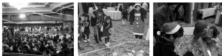
700人超の参加者が集いました。模擬店・フード店は各労組が担当。どの店も賑わっていました。