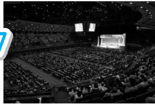
広島には6500人の連合加盟組合員が参集