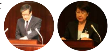
市長以外に企画部長(左)とこども家庭部長(右)が答弁しました。