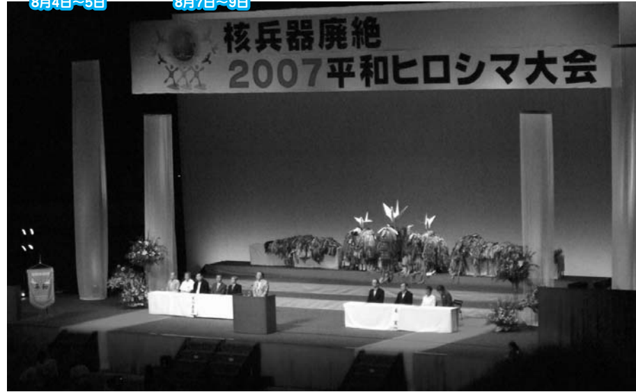
2007平和ヒロシマ大会(4日、広島県立総合体育館)