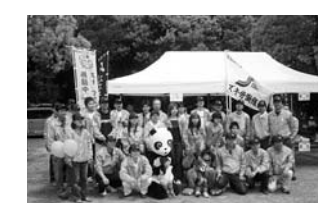
スズキ労組・高塚支部も若手を中心に模擬店を担当。