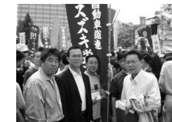
労連からは秋場副会長他7名が参加。太郎旗で存在感をアピール！