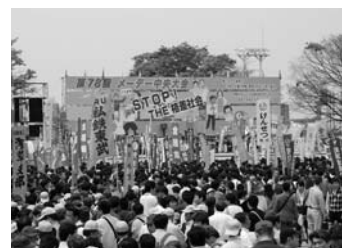
さすがは中央メーデー。人酔いしそうです…