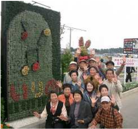
「レインボーいりの」のみなさんと作品